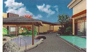
② 寝転び湯、炭酸泉風呂など広々とした露天風呂。女湯には変わり種風呂が1つ多い

▼スパ銭DATA 入浴料 未定 ●入浴時間 10:00～翌2:00(予定) ●風呂数 全22種 / 薬湯、炭酸泉風呂など ●泉質 未定 ●アメニティ 未定