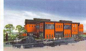
③ 国道171号線沿いにオープンする。大阪モノレール彩都線豊川駅から徒歩5分

▼スパ銭DATA 入浴料 未定 ●入浴時間 未定 ●風呂数 全13種 / 源泉風呂、ジェット風呂など ●泉質 ナトリウム・カルシウム・塩化物温泉 ●アメニティ 未定