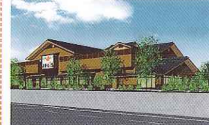
④ 平野台ゴルフセンターの横に立つスーパー銭湯。泉南Cからすぐとアクセスも便利

▼スパ銭DATA 入浴料 ¥600 ●入浴時間 9:00～翌1:00(受付～24:00) ●風呂数 全20種 / 露天風呂など ●泉質 未定 ●アメニティ 未定