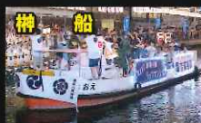
吉富建設株式会社