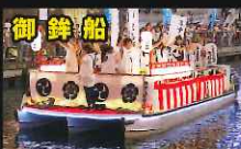
ミナミまち育てネットワーク