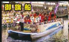
NR3日本理容美容専門学校