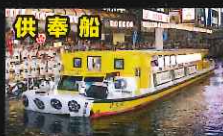
なんばオリエンタルホテル