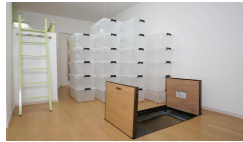
床下にこれだけのケースが 収納可能！