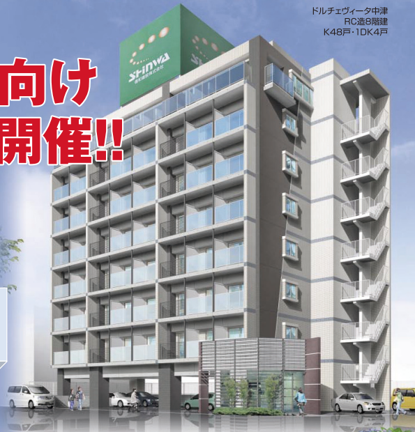
ドレジェヴィータ中津 RC造8階建 K48戸・1DK4戸

※当日セールス、勧誘等は一切行いません。 予約も不要ですので、お気軽にお越し下さい。