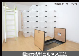
収納力抜群のルネス工法