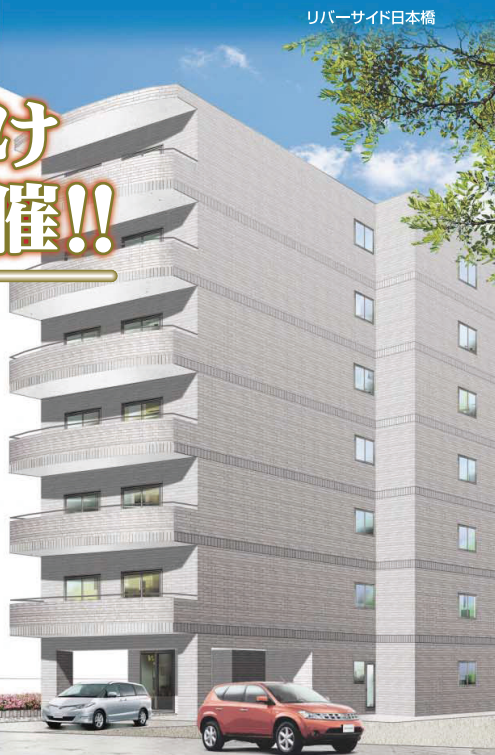
リバーサイド日本橋

鉄筋コンクリートRC造7階建 1LDK(14戸)1SLDK(6戸) ※画像はイメージです。